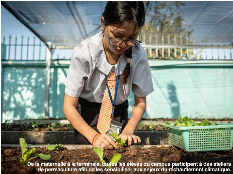
De la maternelle à la terminale, toutes les élèves du campus participent à des ateliers de permaculture afin de les sensibiliser aux enjeux du réchauffement climatique.