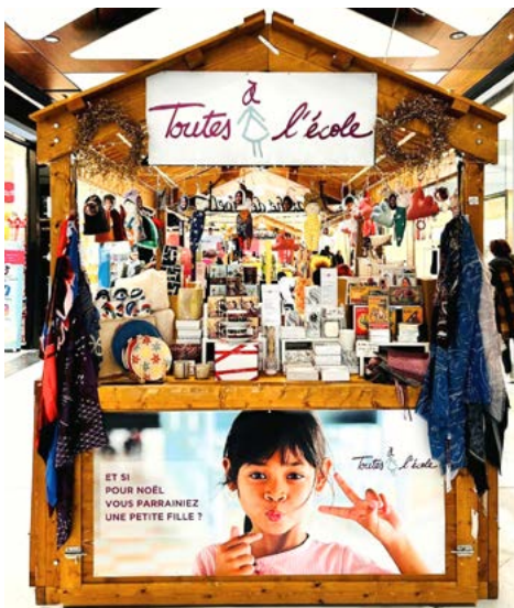
Notre chalet de Noël au mois de décembre 2024 au centre commercial Westfield Parly 2, en région parisienne.